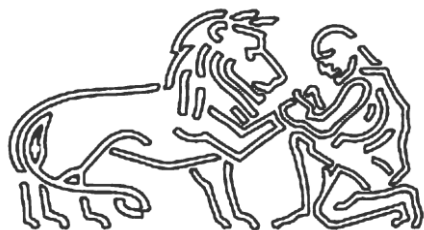
Faculteit der Diergeneeskunde

Wij danken u bij voorbaat voor uw medewerking aan dit onderzoek.